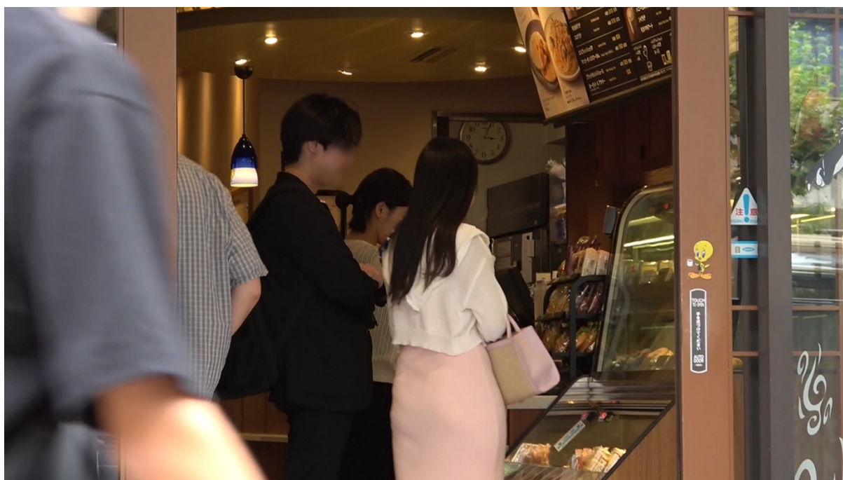
15:03 本人達は注文している様子である。