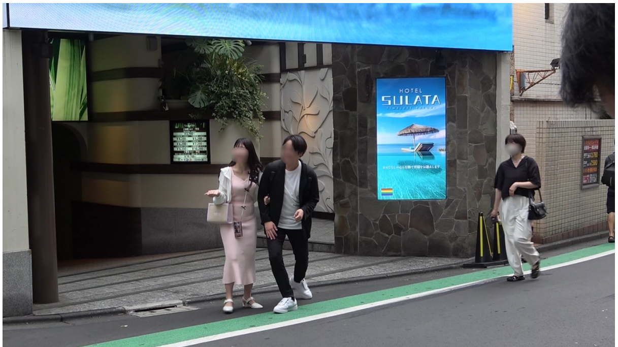
18:15 本人達は道玄坂渋谷駅方面に歩行する。