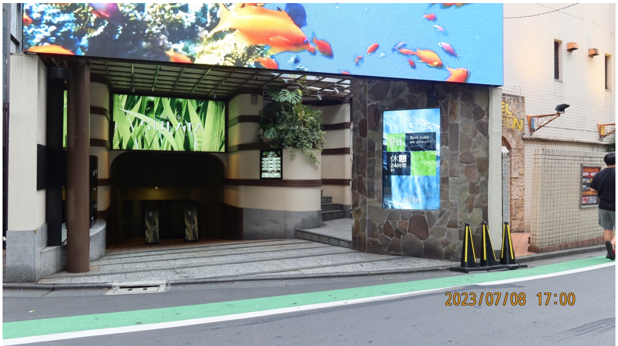
18:00 これまで本人達の行動は見られない。