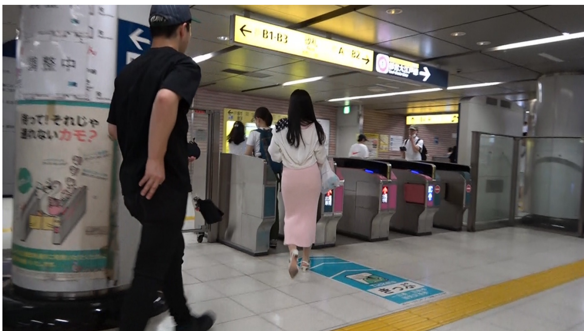
18:51 相手女性は A1 出入り口方面に歩行する。