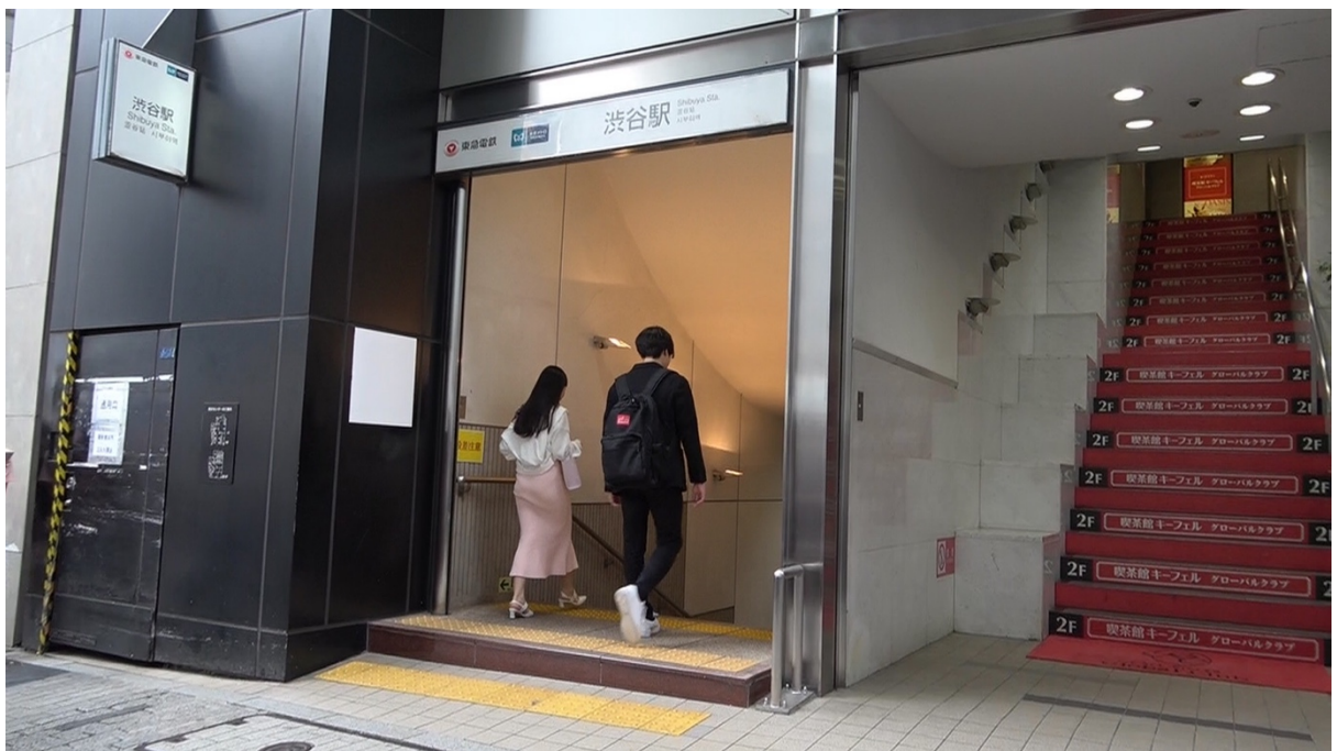
18:26 宮益坂中央改札前で手を振り、別れると相手女性が同改札を通過する。 以降、相手女性を追尾する。