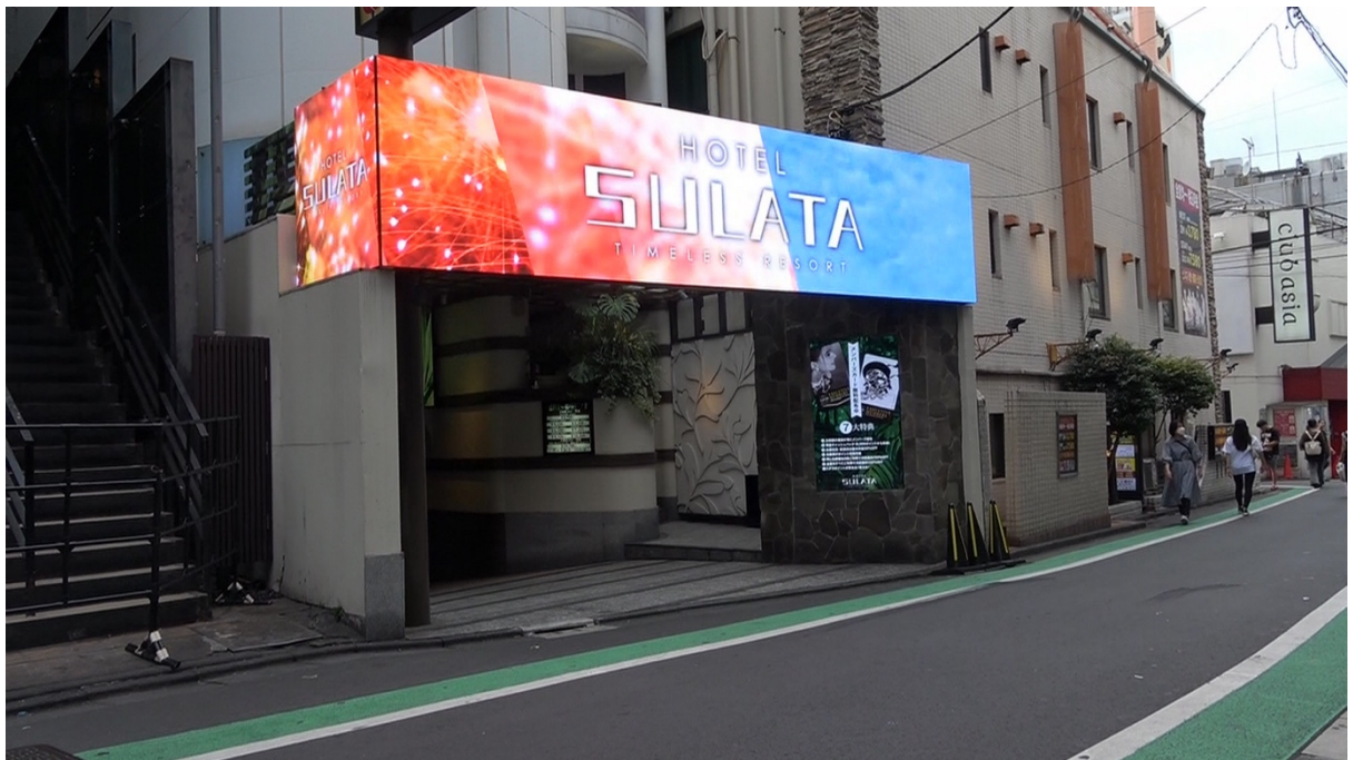
17:00 これまで本人の行動は見られない。