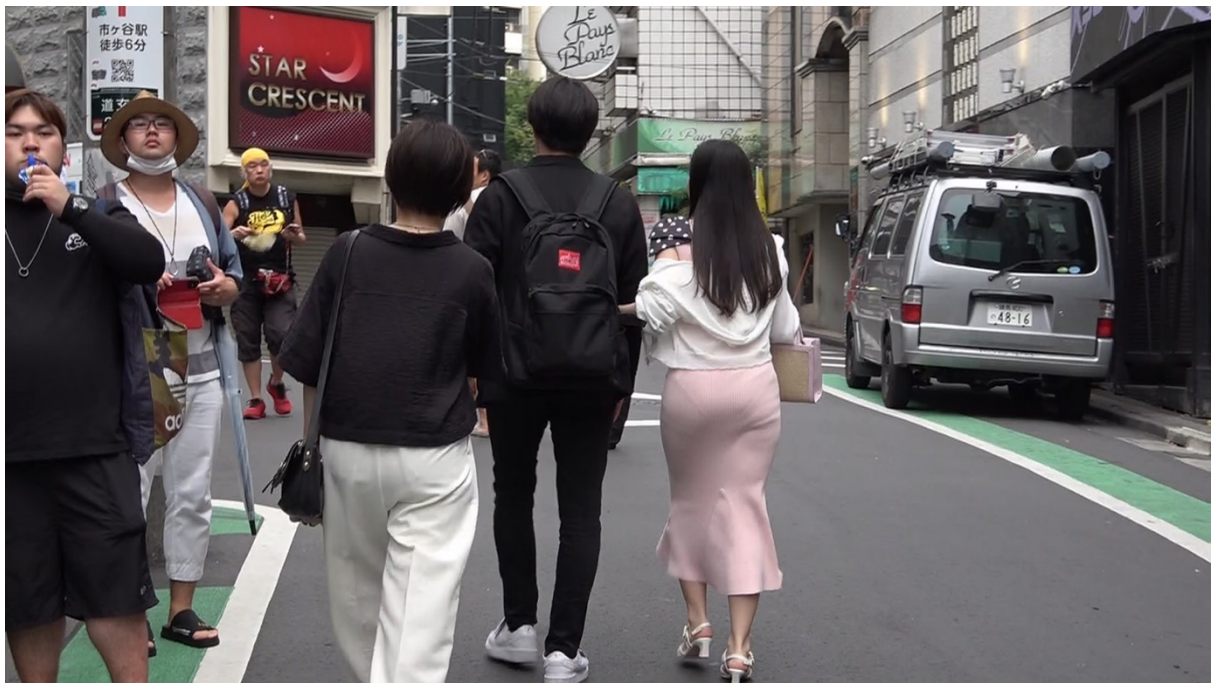
18:19 本人達は渋谷駅 A1 出入口に入る。