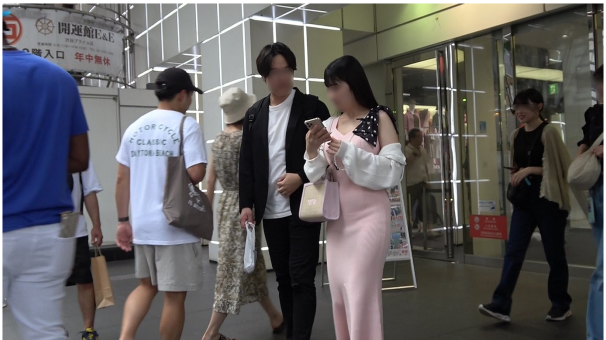
15:59 本人達はランブリングストリート方面に歩行する。