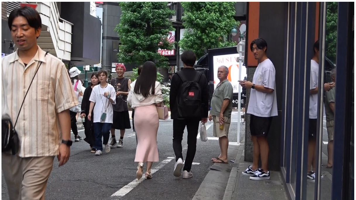
15:26 本人達は公園通りタクシーに乗り、道玄坂方面に走行する。