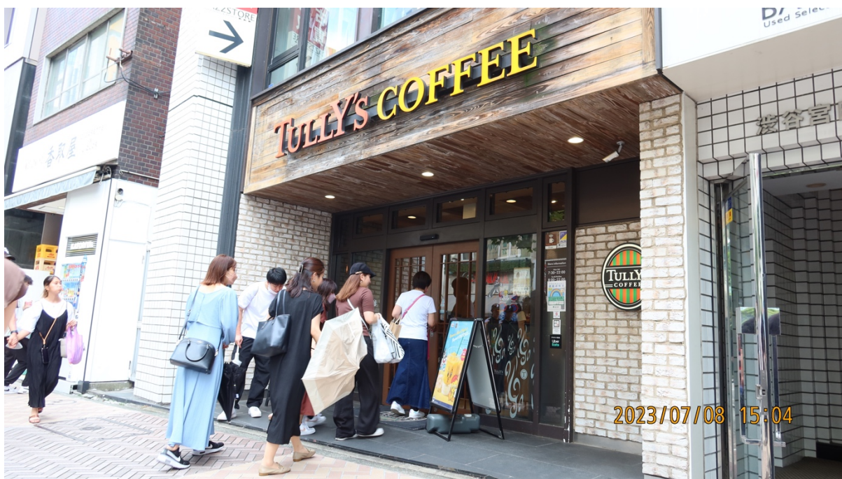
15:05 同店から本人達が出る。※同店は満席だった様子である。