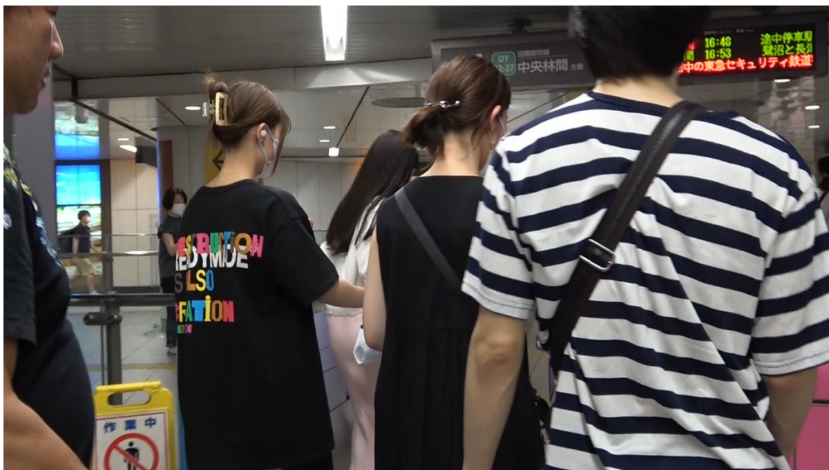
18:29 相手女性は東京メトロ副都心線5、6番ホームを歩行する。