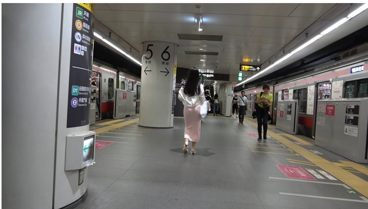
18:31 6番ホームにて電車を待っている様子である。