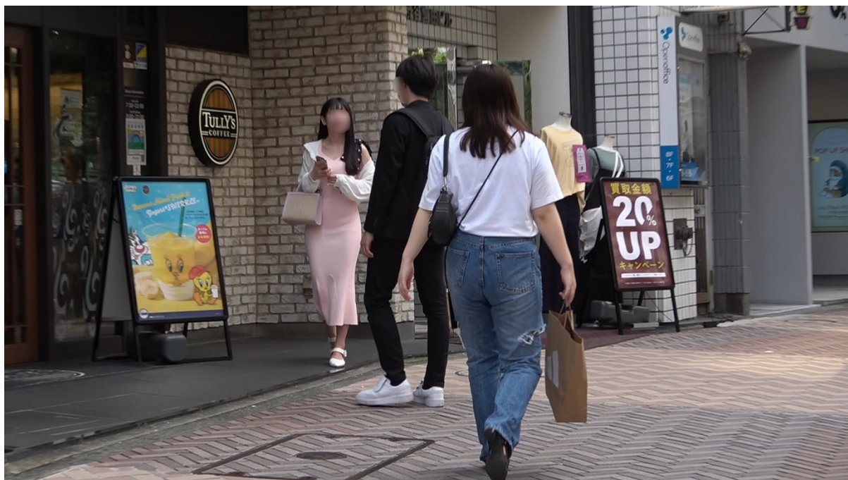
15:01 本人達は同店に入店する。