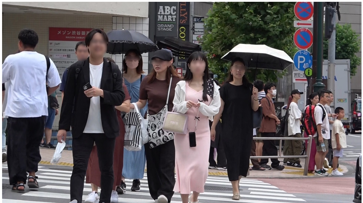
15:08 本人達は店舗ビル「VORT 渋谷 brill」(東京都渋谷区神南1-20-4)に入り、エレベーターで3階に上がる。 ※同ビル3階にはカフェ「スズカフェ神南」が入っており同店に入店した様子であり、同ビルエレベーターを注視する。