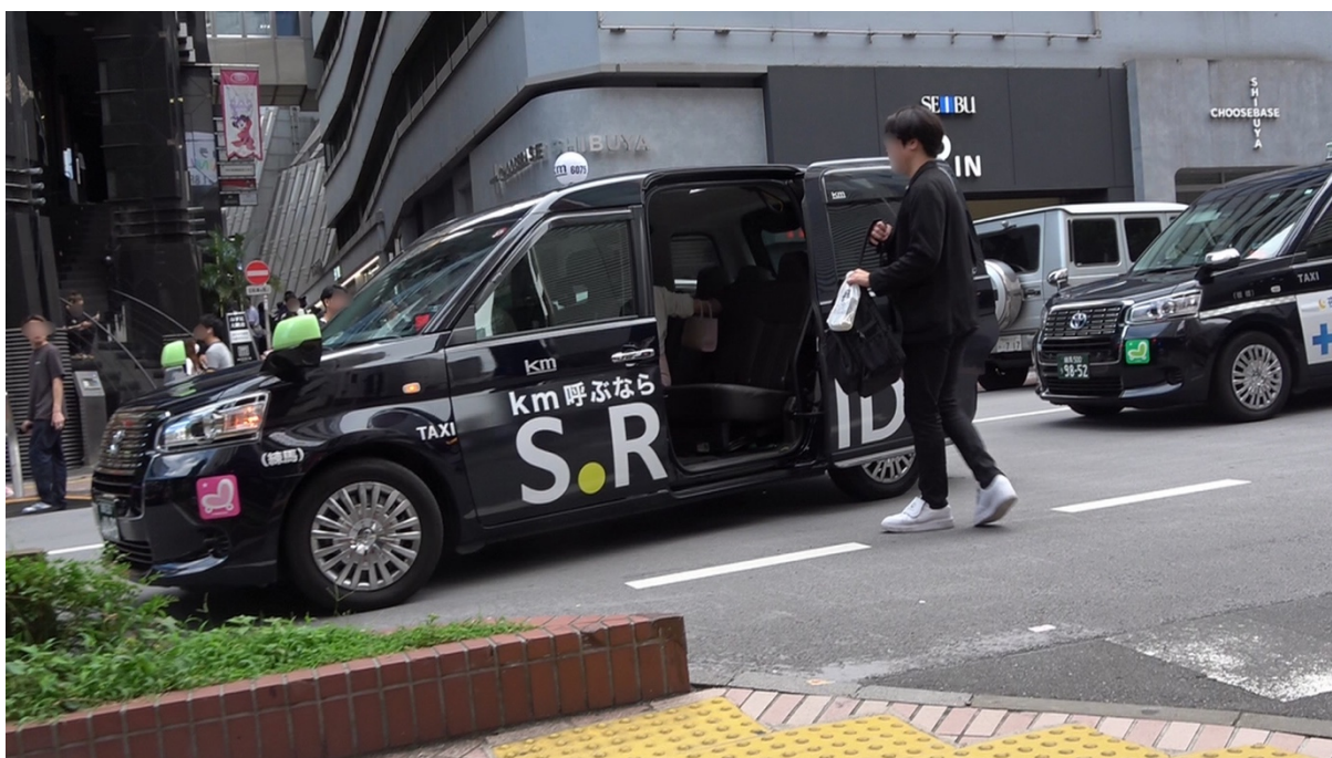
15:36 本人達は衣料品店「ユニクロ道玄坂店」(東京都渋谷区道玄坂2-29-5)前でタクシーを降り、同店に入店する。