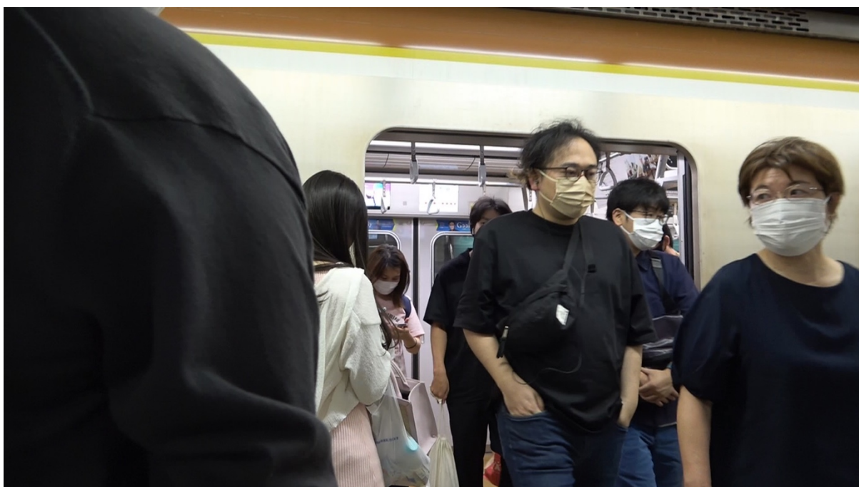
18:47 相手女性は東新宿駅で降りる。