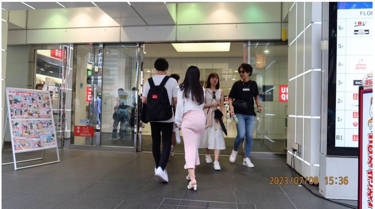
15:42 本人達は同店でウインドショッピングしている様子である。