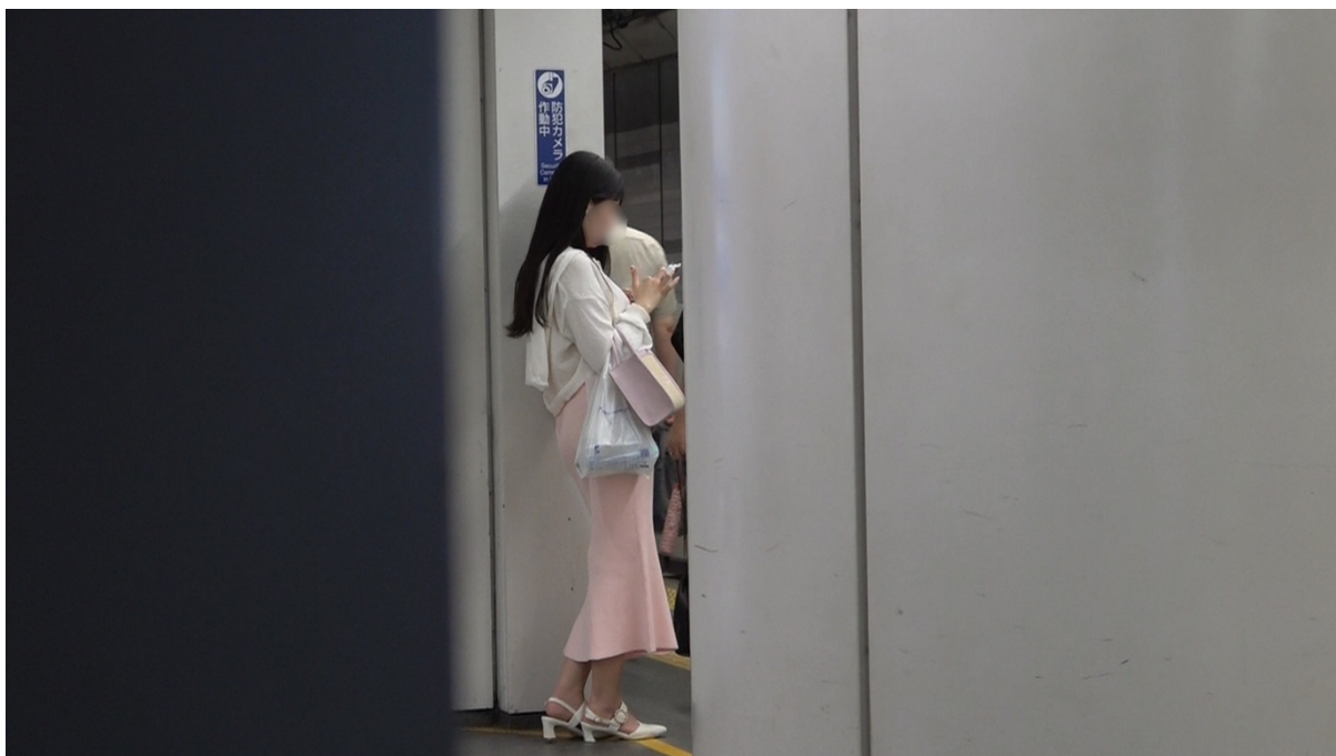
18:34 相手女性は6番ホームから池袋行きに乗る。