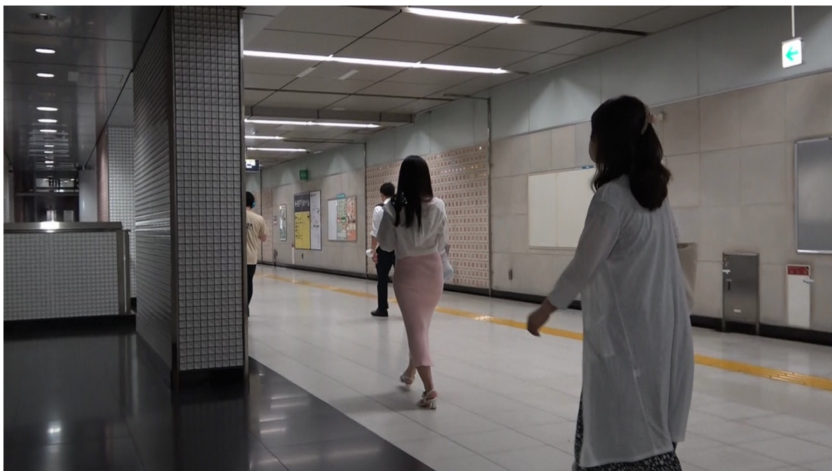
18:48 相手女性は改札を通過する。