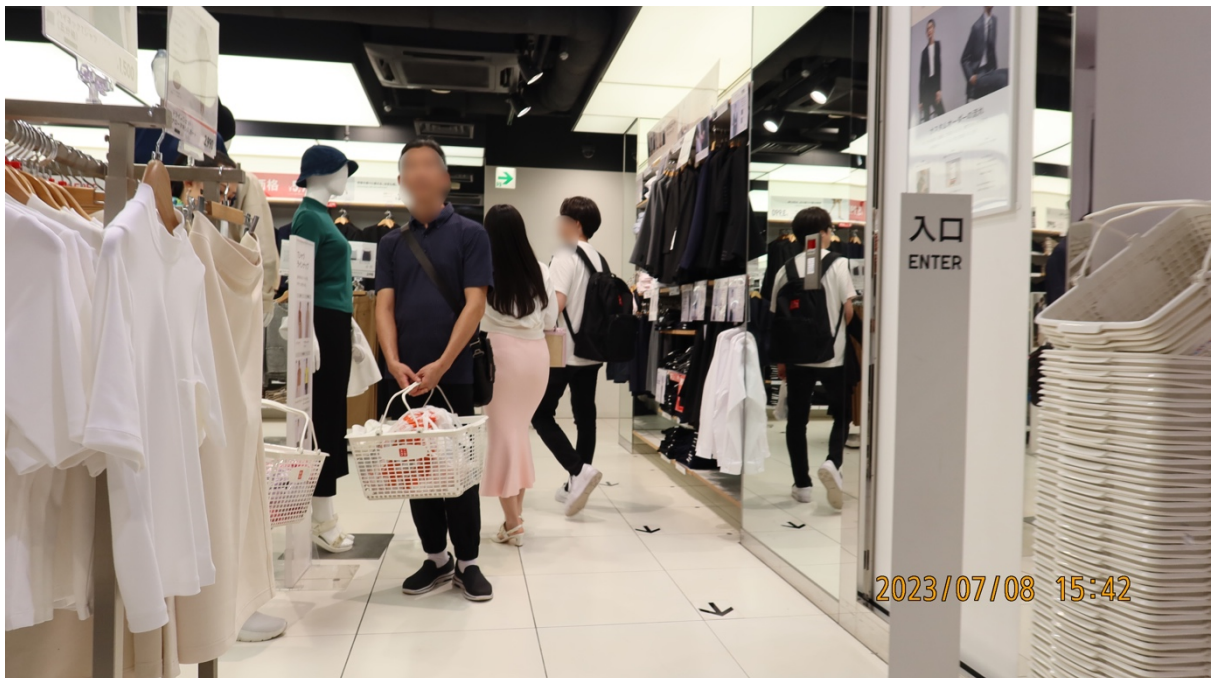
15:58 本人達は同店を退店する。