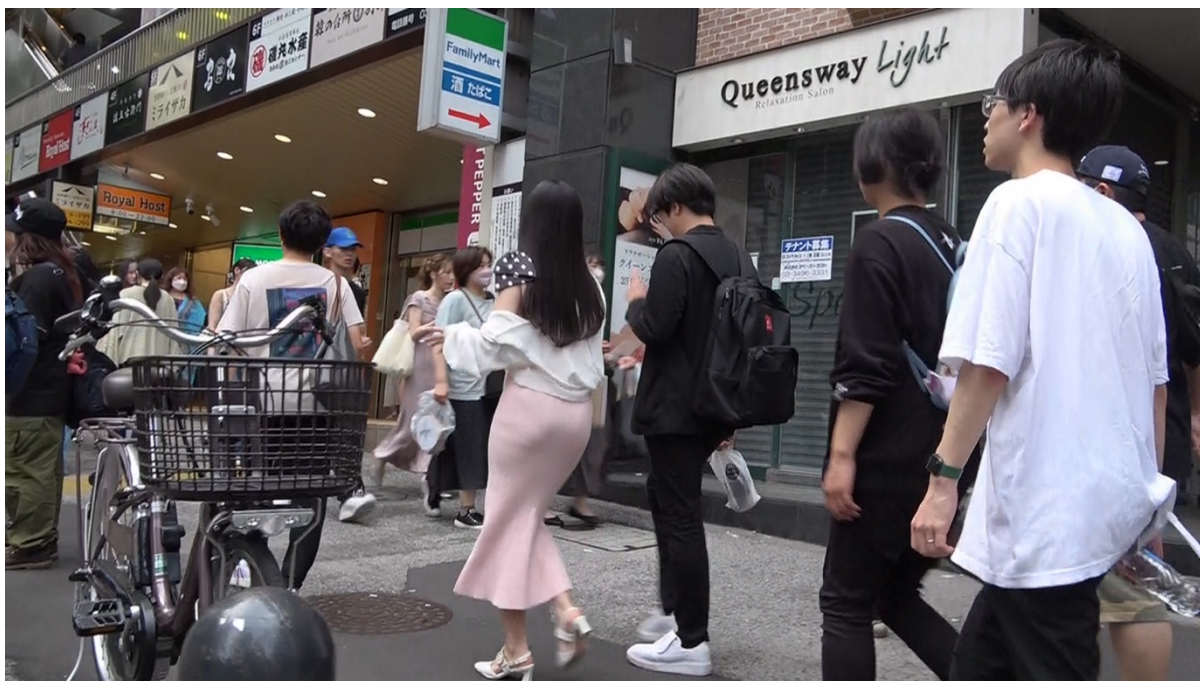
16:04 本人達はコンビニ「ローソン渋谷ランブリングストリート店」(東京都渋谷区円山町2-3)に入店する。